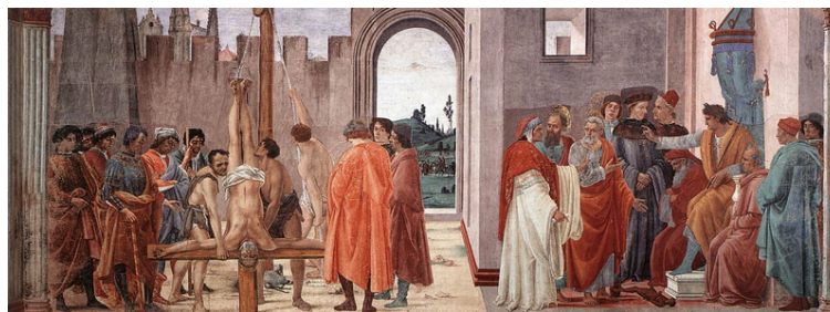
Petrus und Paulus vor Nero im Disput mit Simon Magus und Kreuzigung Petri