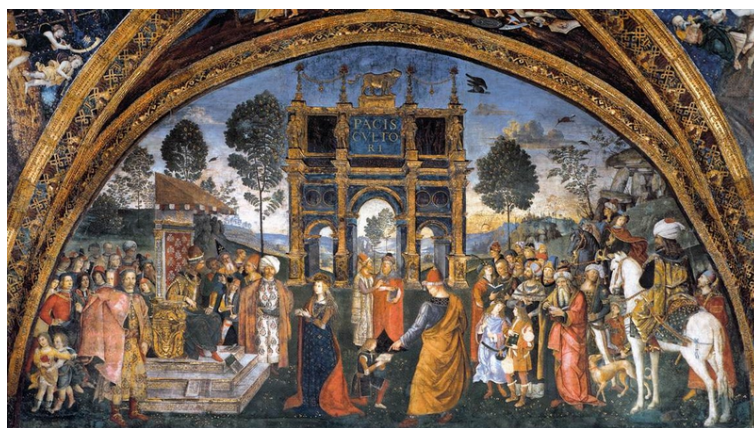
Disputa der hl. Katharina

Vatikan; Vatikanstadt; Palazzi Pontifici