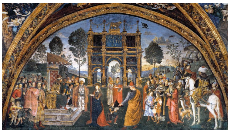
Disput der hl. Katharina

Vatikan; Vatikanstadt; Palazzi Pontifici