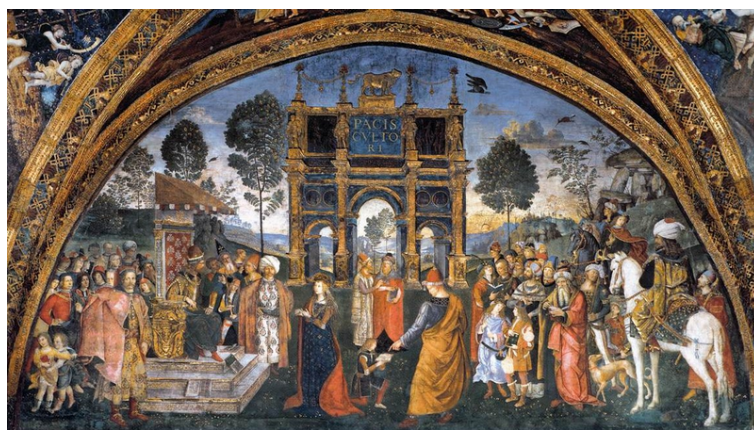
Disput der hl. Katharina

Vatikan; Vatikanstadt; Palazzi Pontifici