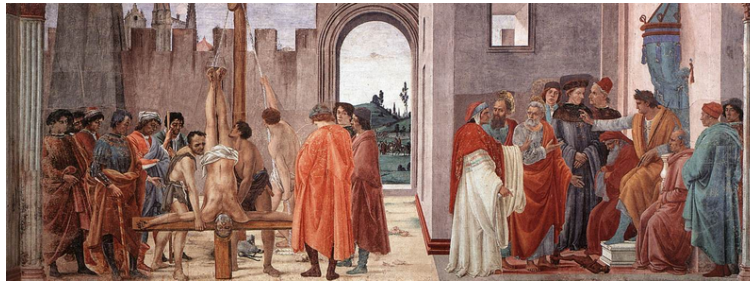
Petrus und Paulus vor Nero im Disput mit Simon Magus und Kreuzigung Petri