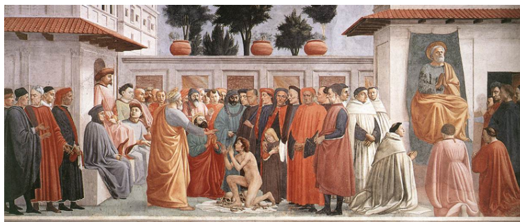
Auferweckung des Theophilus-Sohnes und Petrus in Cathedra

Italien; Florenz; Santa Maria del Carmine